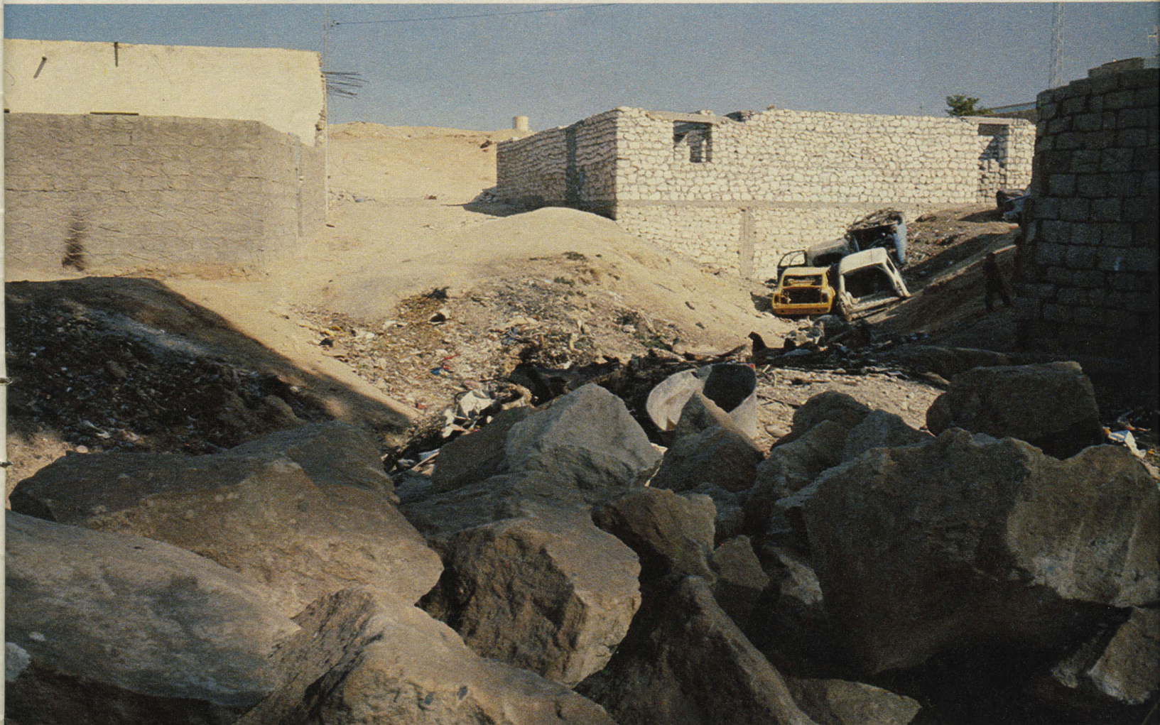
Gafsa: «Staub und Zivilisationsschrott.»