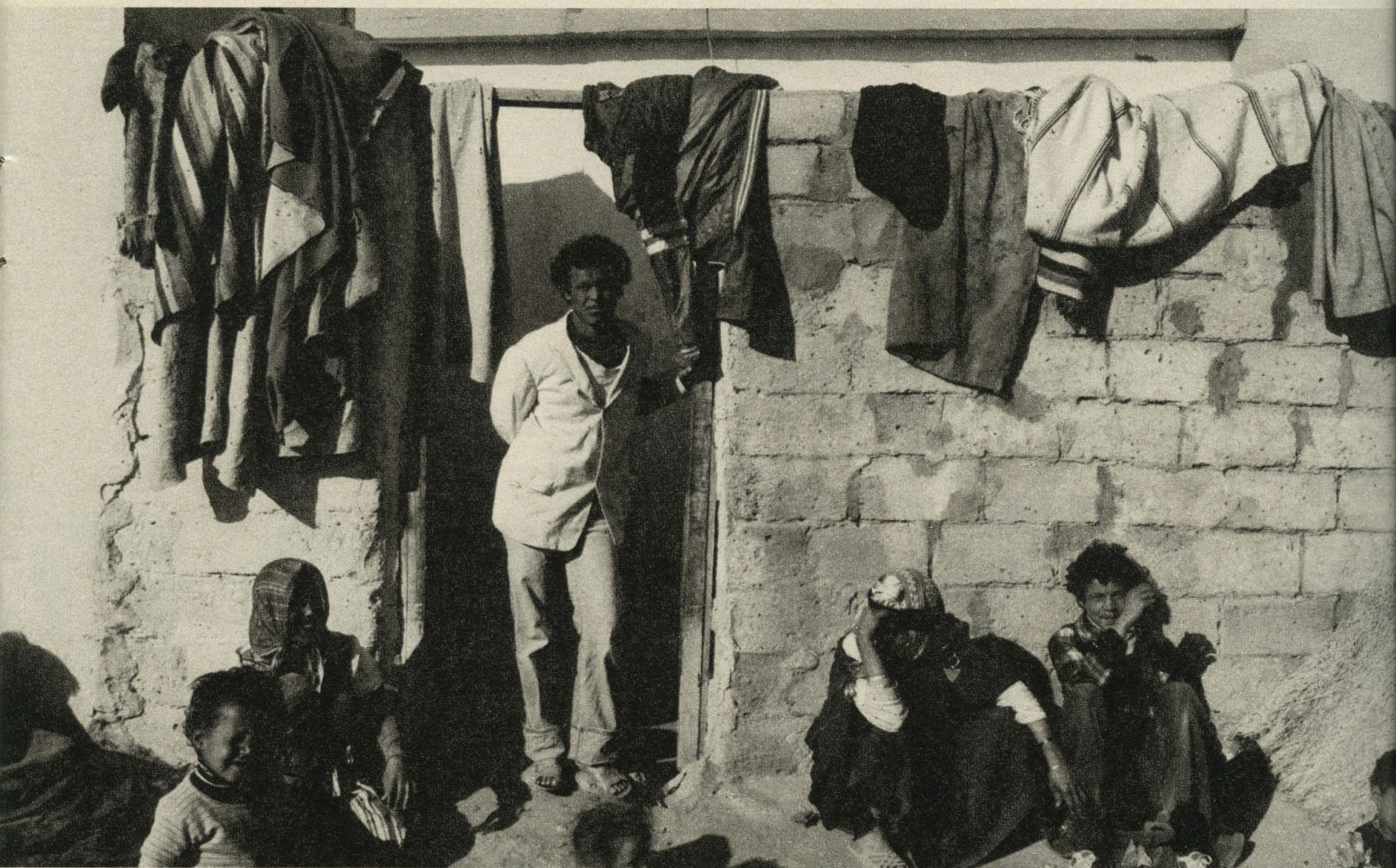
Altstadt von Tunis: «In ein Gesicht zu gucken habe ich versäumt.»