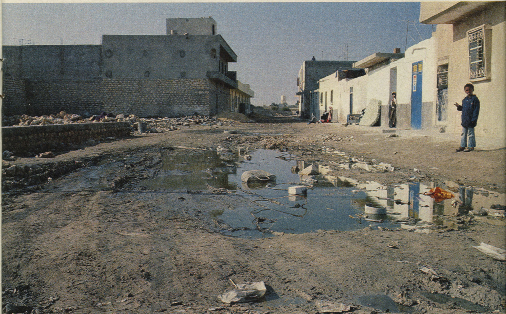
Gabès: «Ein einziger See aus Schlick und weichem Dreck . . .»